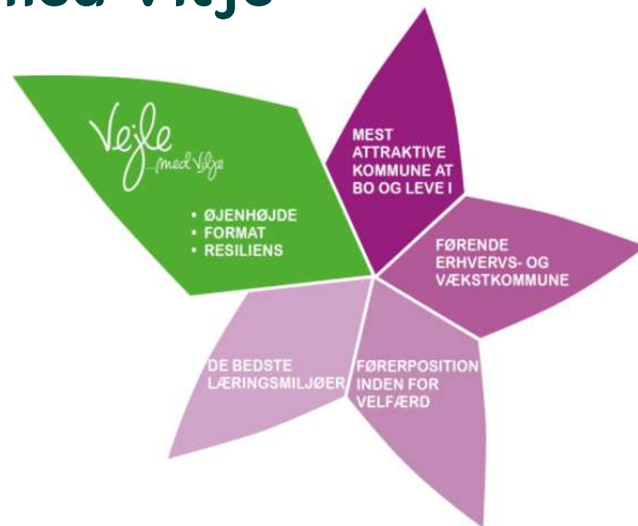
Grafisk illustration af Byrådets vision: Vejle med Vilje

”Vejle er en vækstkommune, og vi vil sikre en klog og bæredygtig vækst , der giver mening både for de, der allerede bor her, og for vores tilflyttere.”